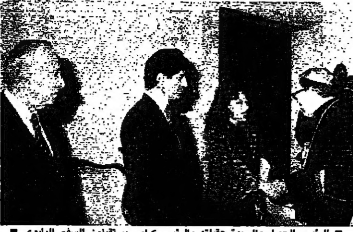
الرئيس الجميل والسيدة علفاته والرئيس كرامي يستقبلون السفير البلوي